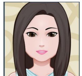
Domina Gallée Magistra linguae latinae